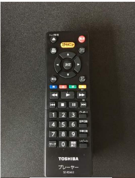
ブルーレイデッキ