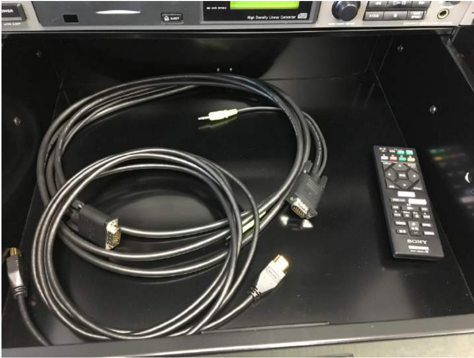
①RGB ケーブル ②HDMI ケーブル ③リモコン(ブルーレイデッキ)