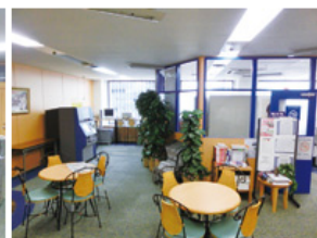
ラウンジ (約144平方メートル) ・テーブル個数: 4個 ・椅子個数: 20脚 ・50インチ液晶テレビ ・DVDプレイヤー